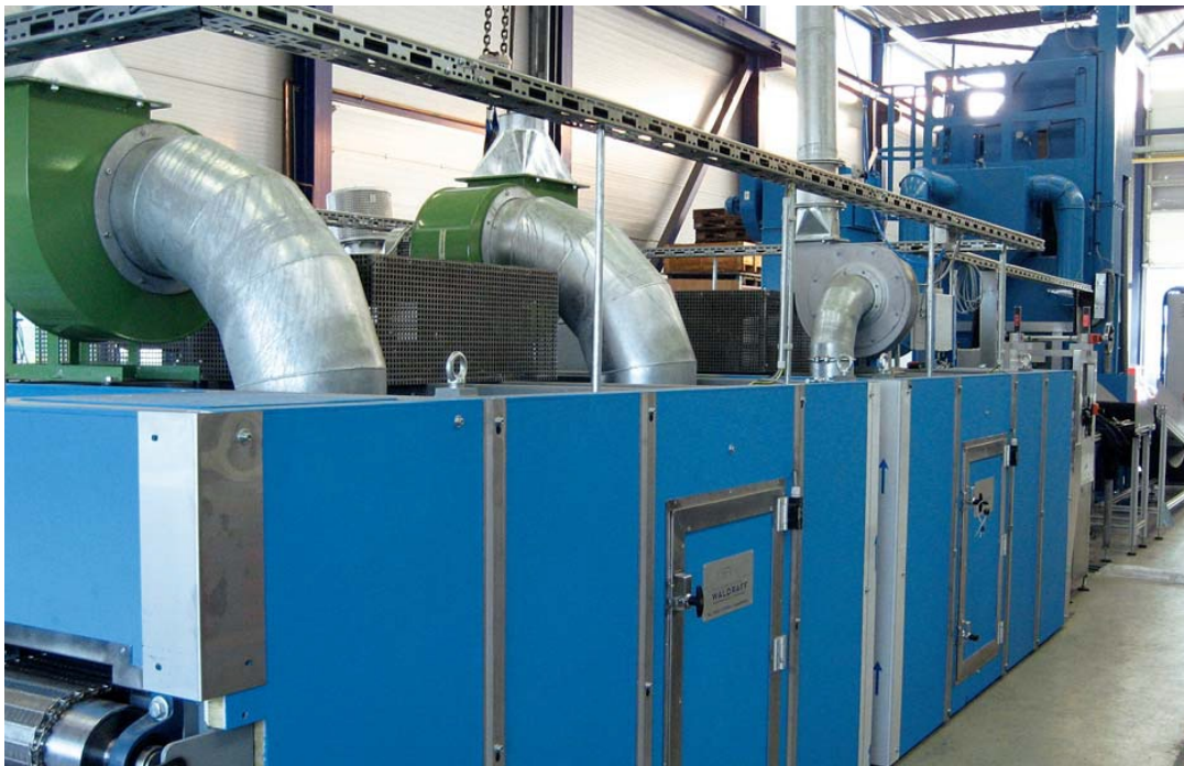
Rotationsofen für Kleberbeschichtung

Die genannten Eigenschaften sind typische Werte aus Reihenprüfungen, die nach anerkannten Prüfmethode ermittelt wurden. Werkstoff- und produktspezifische Streuungen sind zu berücksichtigen. Die Angaben stellen keine zugesicherten Eigenschaften dar und können nicht für eine Gewährleistung herangezogen werden. Technische Änderungen behalten wir uns vor.